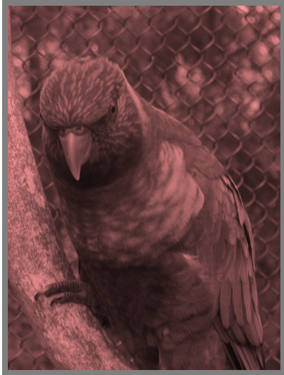
FIGURE 1.1 PARROT BAY